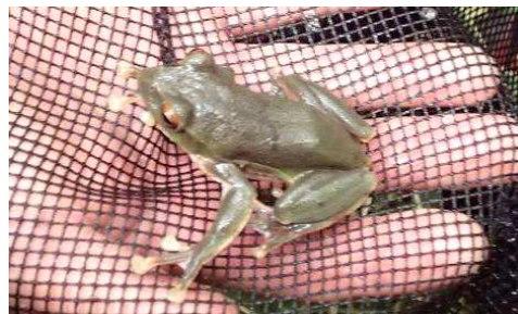
小さなモリアオガエル

初夏の六甲山の森で、静かに生きているモリアオガエルとの出会い、卵塊の観察を楽しみませんか