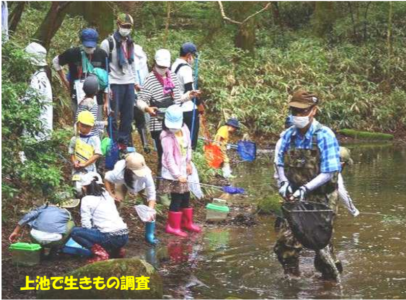
上池で生きもの調査