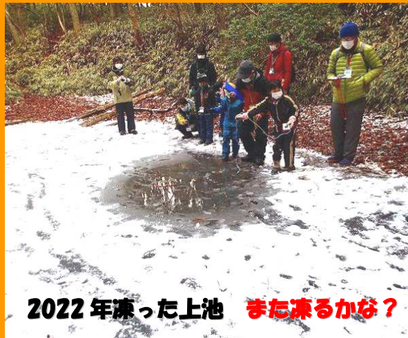
2022年凍った上池 また凍るかな?