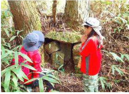
①結願札所の第33番石仏