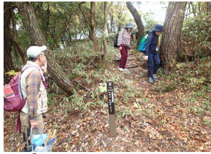
②灘区北端の第28番石仏