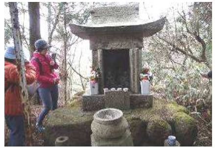
③行者堂・役行者碑