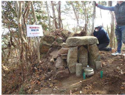
④修復した第24番石仏

シュラインロードには「西国三十三カ所巡り」の石仏が200年たらずでいます。六甲山の貴重な歴史文化遺産です。建立200周年の保全活動にご参加ください！