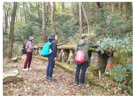
⑤到着始点の「九体仏」

シュラインロードには「西国三十三カ所巡り」の石仏が200年たらずでいます。六甲山の貴重な歴史文化遺産です。建立200周年の保全活動にご参加ください！